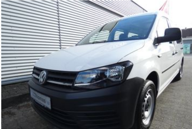
Fritz Thomas GmbH & Co. KG