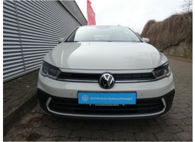
Fritz Thomas GmbH & Co. KG