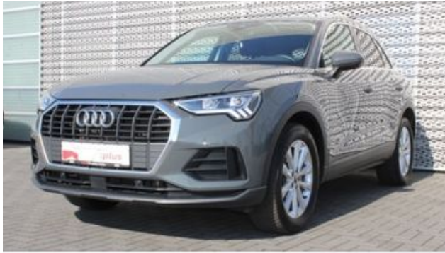
Fritz Thomas GmbH & Co. KG