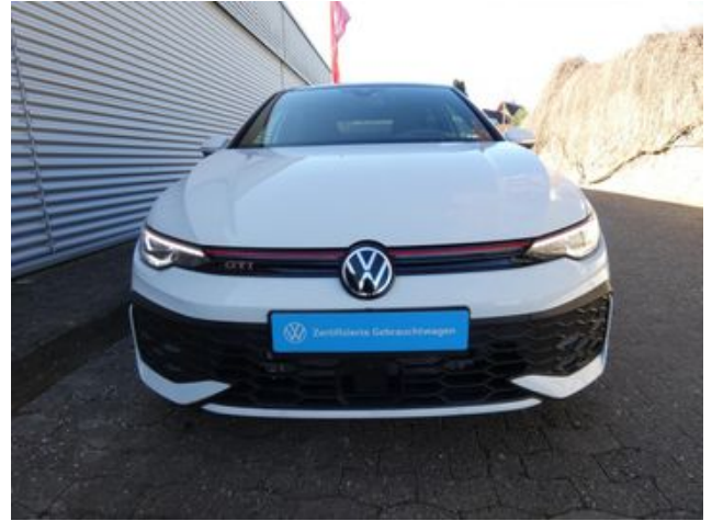
Fritz Thomas GmbH & Co. KG