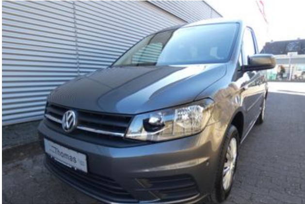
Fritz Thomas GmbH & Co. KG