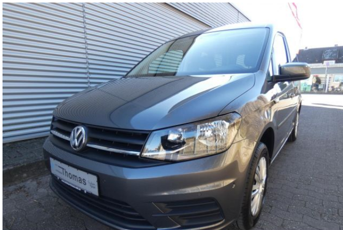
Fritz Thomas GmbH & Co. KG