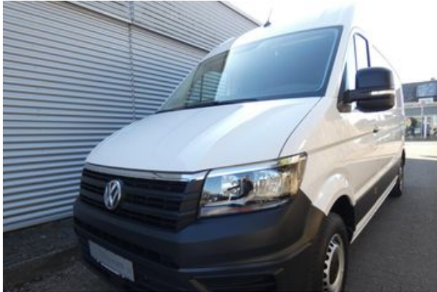
Fritz Thomas GmbH & Co. KG