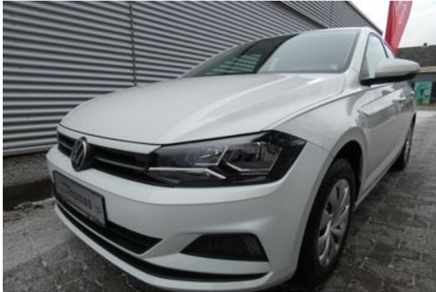
Fritz Thomas GmbH & Co. KG