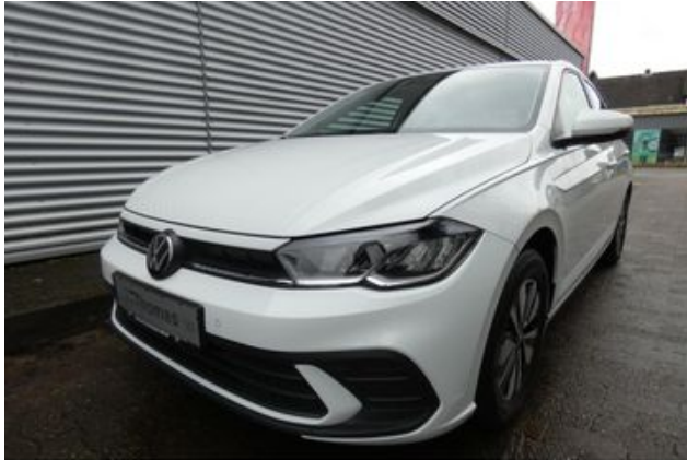
Fritz Thomas GmbH & Co. KG