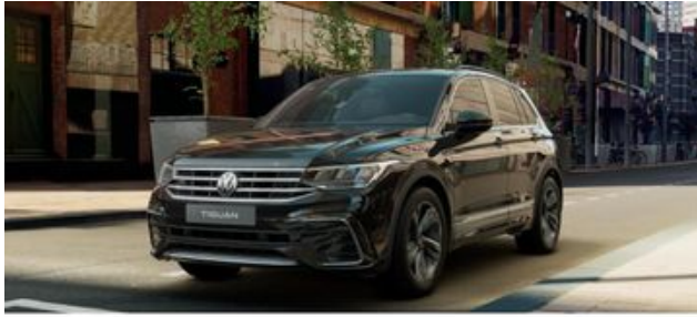
Fritz Thomas GmbH & Co. KG