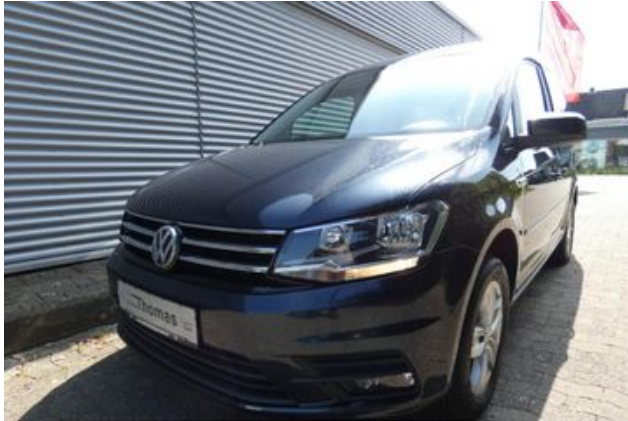
Fritz Thomas GmbH & Co. KG