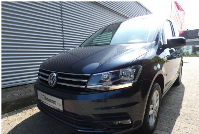
Fritz Thomas GmbH & Co. KG