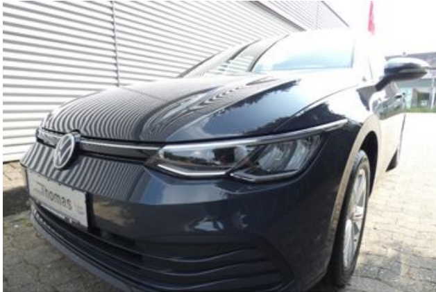
Fritz Thomas GmbH & Co. KG