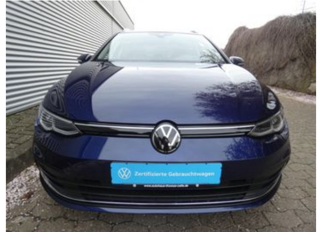
Fritz Thomas GmbH & Co. KG