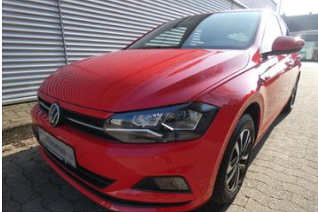
Fritz Thomas GmbH & Co. KG