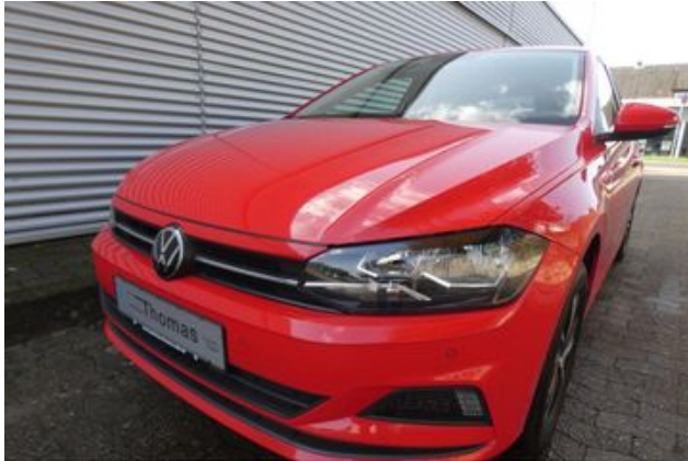
Fritz Thomas GmbH & Co. KG