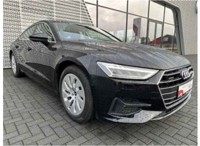
Audi Gebrauchtwagen :plus