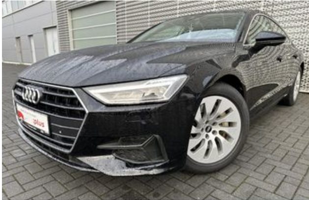
Fritz Thomas GmbH & Co. KG