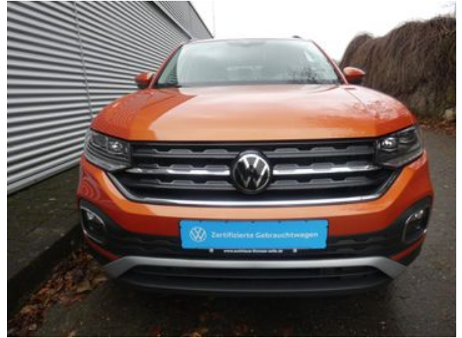
Fritz Thomas GmbH & Co. KG