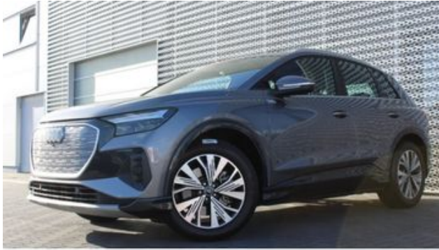
Fritz Thomas GmbH & Co. KG